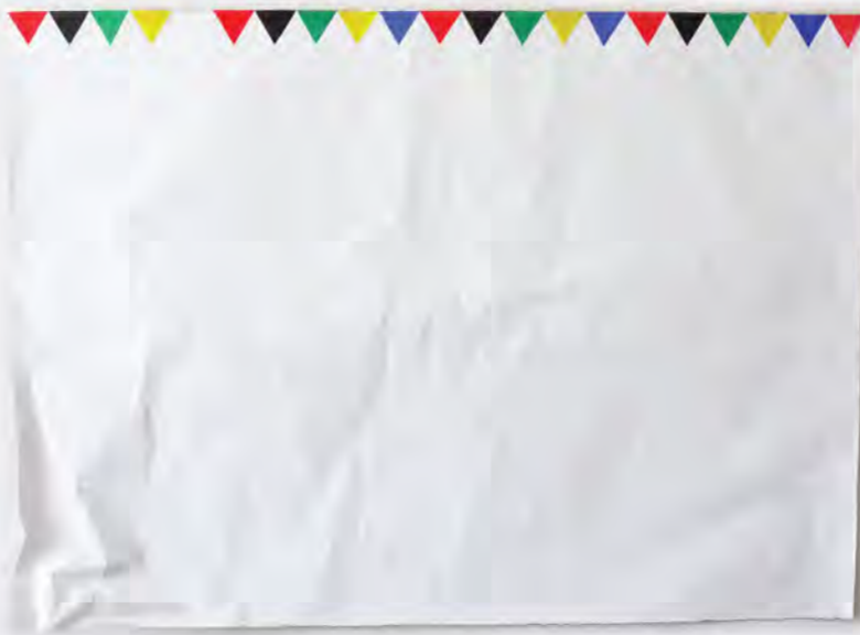
Happy Valley Acrilico en Foil de Aluminio 100 x 77 cm 2013

Supported using public funding by ARTS COUNCIL ENGLAND