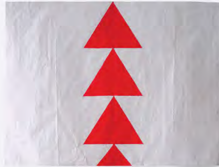
Felices Fiestas Acrílico en Foil de Aluminio 19 x 25 cm 2013

All We Got Was Cold (2013) resembles a slumped but ironed out length of sixties wallpaper. Heavy with the weight of its debt to history, but at the same time bright and playful, repeated spheres flow into a single line of what could be subbuteo as it hits the floor. The idea of old fashioned games and celebratory icons also appear in Happy Valley (2013). Here we're charmed by a humble yet striking line of miniature rainbow bunting, recalling the jubilation of a country fete. Its surface is clearly painted with Sánchez's hallmark precision, but there's a strong evocation of the hobbyist or collector through the use of such battered, seemingly found material.