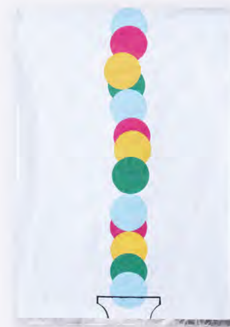
All We Got Was Cold Acrilico en Foil de Aluminio 46 x 32 cm 2013

For the English version visit www.lizisanchez.com