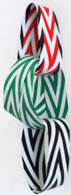
Cadeneta I Acrílico en Foil de Aluminio 28 x 10cm 2013

Whereas Untitled dupes the viewer with its pumped up glamour, This Side of Paradise (2013) languishes on the floor. Strwn over-sized wrappers or foil sheets drape across a wooden pallet that supports these lazy looking forms, introducing an unlikely industrial element that satisfyingly complicates the work. The pallet, with its rough surface and utilitarianism, is a mechanism Sánchez uses to remind us that this sculpture came from the studio, home of the skilled worker. This sense of industrialism, of hard graft, is apparent in the meticulous hand-painted foils that feature Varvara Stepanova-like chevrons, and bold magenta diamonds from a Harlequins costume. Perhaps these shapes are strict page markers from a printers press, waiting to be lined up, but at the same time we're reminded of home made Christmas decorations from childhood days. There's something distinctly homely and nostalgic about this work.